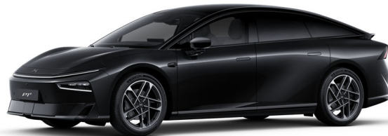
Midnight Black 350 000 Ft