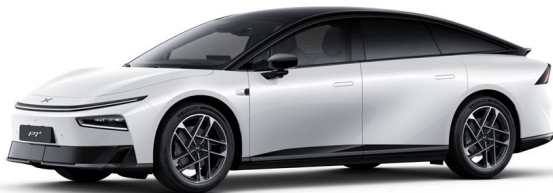
Arctic White 0 Ft