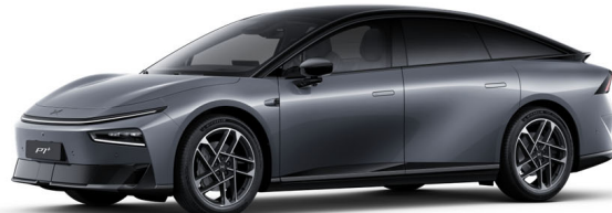
Graphite Gray 350 000 Ft