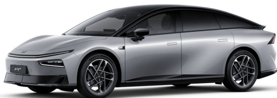
Silver Frost 350 000 Ft