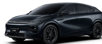
Black Edition [în cazul versiunilor Performance]