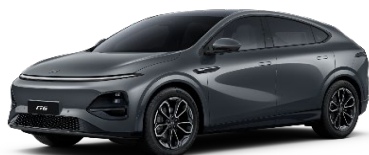
Graphite Gray 550 EUR