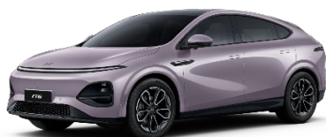
Stellar Purple 550 EUR