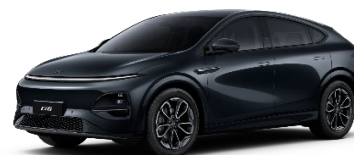
Midnight Black 550 EUR