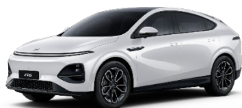
Arctic White 0 EUR