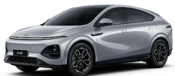
Silver Frost 550 EUR