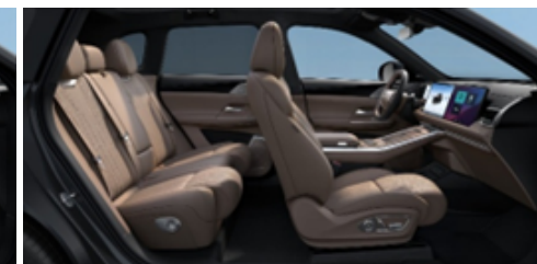
Tapițerie din piele ecologică culoare coffee