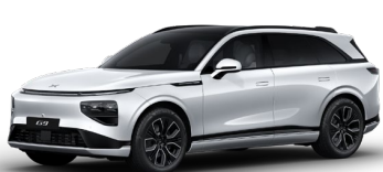
Vopsea Alb Arctic 0 EUR