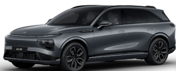
Vopsea Gri Grafrit 1 050 EUR