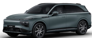
Vopsea mată Verde Kaitoke 1 200 EUR [numai pentru versiunea Performance]