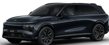
Negru Midnight 1 050 EUR