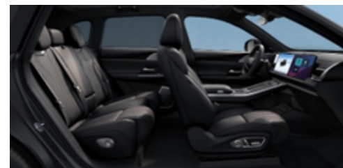
Tapițerie din piele ecologică închisă la culoare