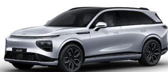
Argintiu Frost 1 050 EUR