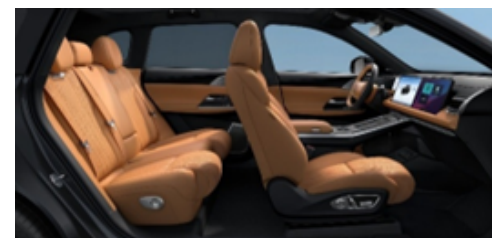
Tapițerie din piele ecologică culoare Saddle