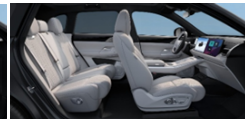
Tapițerie din piele ecologică gri