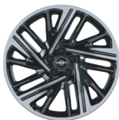
20" ALU disky „Diamond Cut“, pneumatiky 245/45 R20